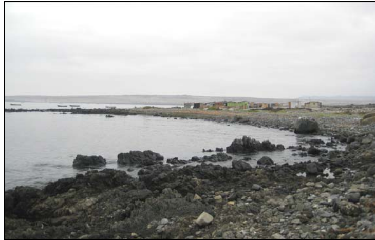
Fotografía 2. Caleta Auxiliar Chascos