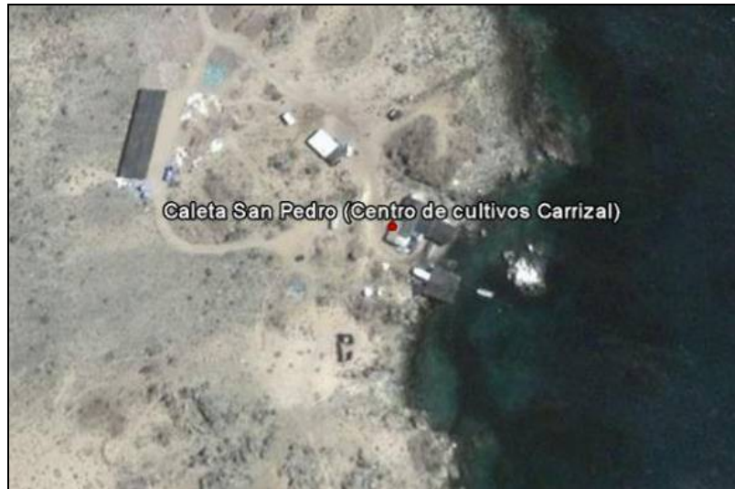
Figura 2. Imagen satelital Caleta San Pedro e instalaciones en tierra del Centro de Cultivos Carrizal (Fuente: Google Earth).