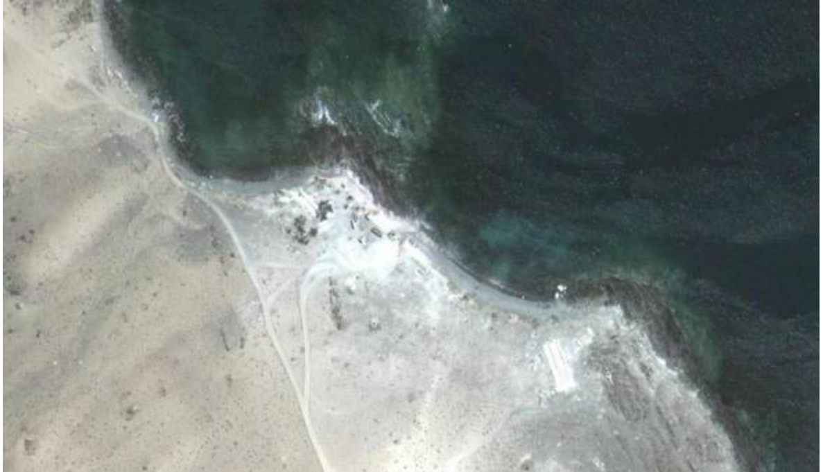
Figura 3. Patrón de Asentamiento Caleta Chascos.