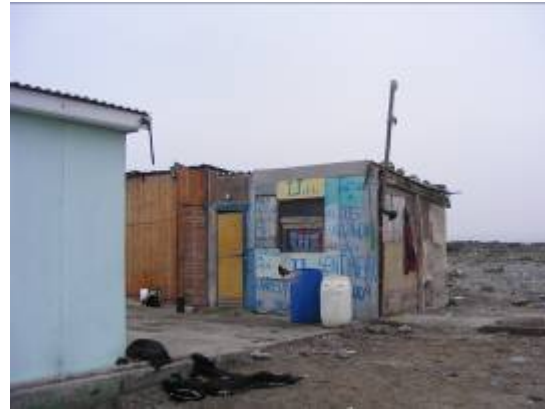
Fotografía 5 y 6 Viviendas, Sector Chascos.