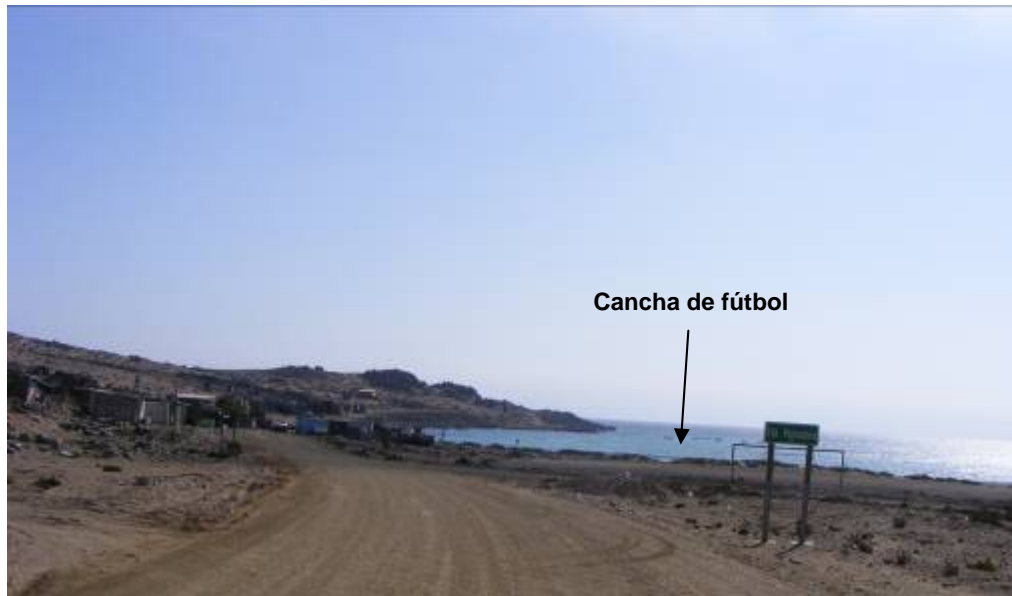
Fotografía 15. Infraestructura Comunitaria, Sector Pajonales