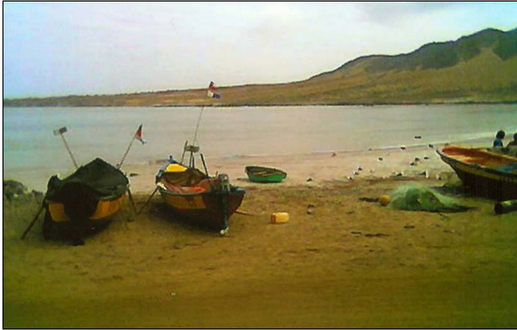
Fotografía 7. Caleta Pajonales y algunas de sus embarcaciones.