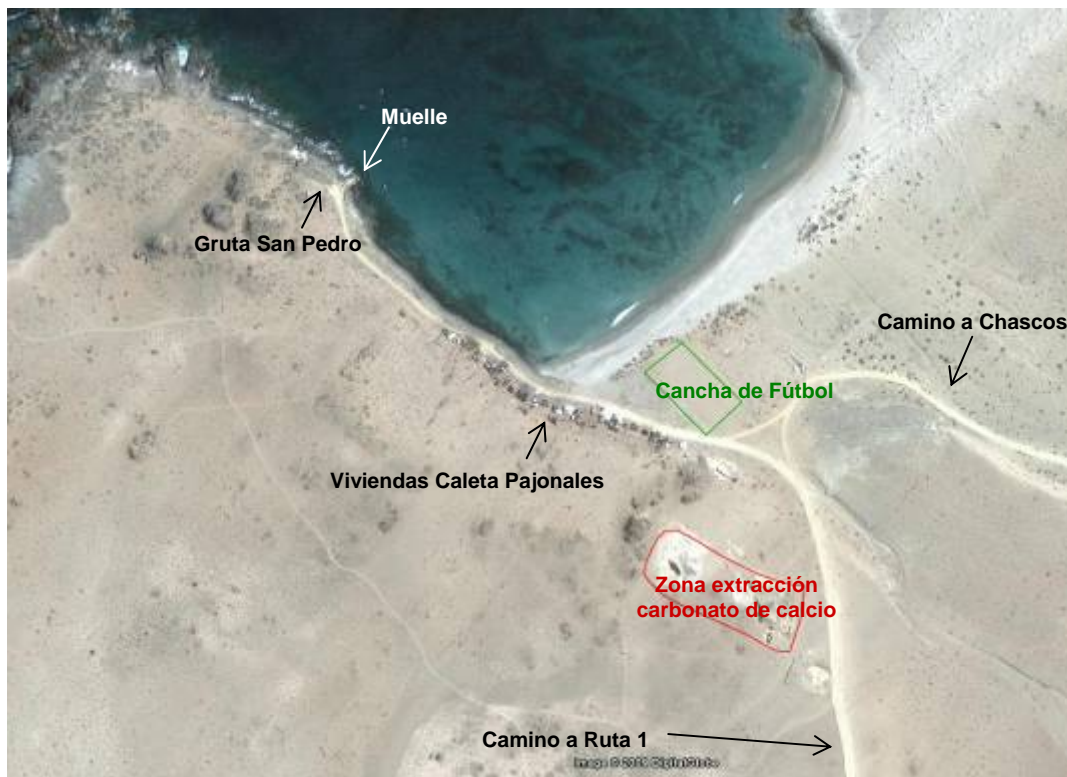
Figura 5. Patrón de Asentamiento Caleta Pajonales.

La ubicación de Caleta Pajonales junto a su infraestructura es posible apreciarla en la siguiente figura 5 :