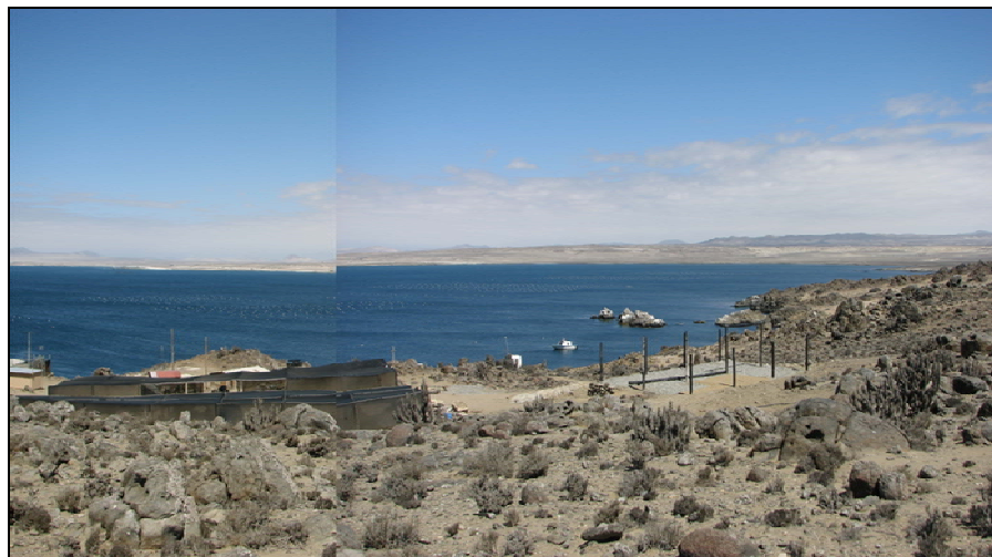
Fotografía 1. Centro de Cultivos Carrizal en Bahía Chascos.