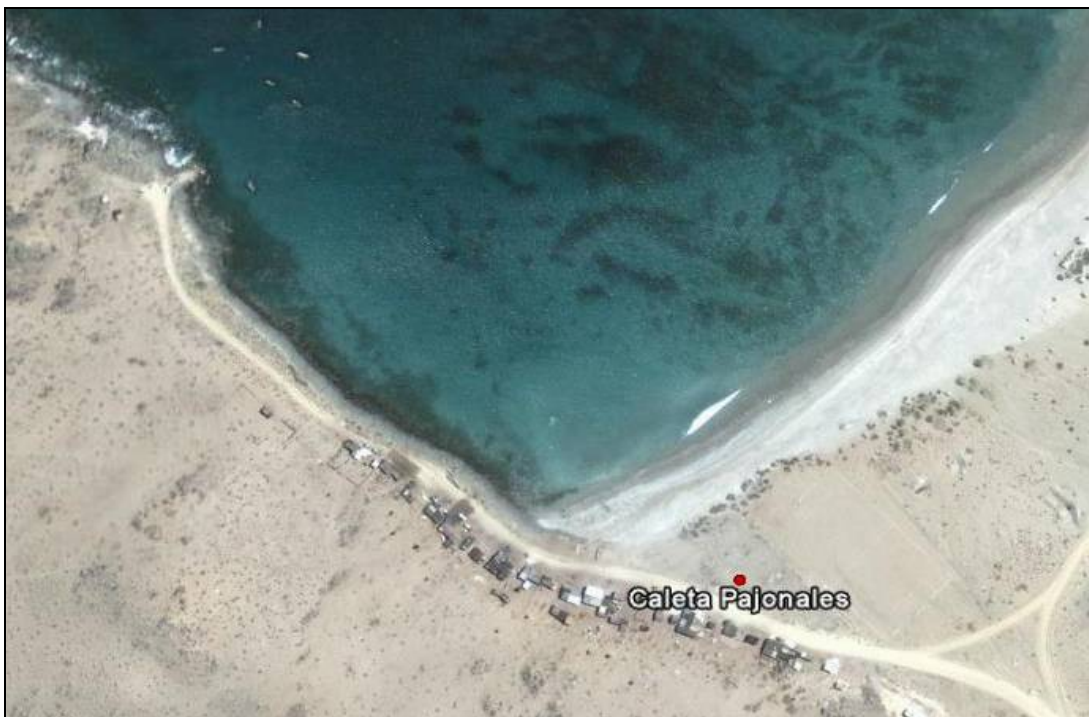
Figura 4. Imagen satelital Caleta Pajonales.

Ubicada en el lado sur de Punta Cachos en los 27° 44' S; 71° 03' W ( Figuras 4 y Fotografías 7 y 8 ). Esta caleta figura como caleta de pescadores oficial en el registro del Ministerio de Defensa Nacional, Subsecretaría de Marina, D.S. N° 240/1998. Según la información obtenida en terreno y posteriormente contrastada con lo señalado en el portal de la Subsecretaría de Pesca ( www.subpesca.cl ), esta caleta cuenta con 43 pescadores artesanales, 8 embarcaciones y 1 sindicato de pescadores con 22 socios 9 (S.T.I. de Pescadores Artesanales Caleta Pajonales). Los recursos aquí extraídos son vendidos en Caldera principalmente, aunque también Huasco y Copiapó figuran como sus mercados ocasionales. Esta caleta se ubica en un terreno privado, no cuenta con muelle artesanal ni presenta servicios básicos.