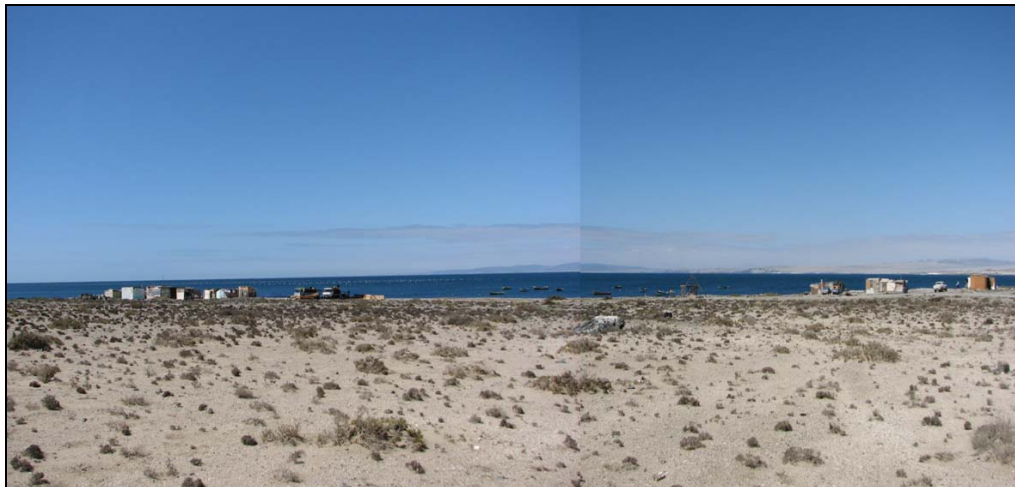
Fotografía 3. Caleta Auxiliar Chascos