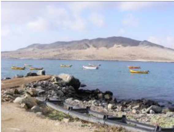
Fotografía 13 : Muelle Caleta

En cuanto a espacios de recreación, la población no señaló ningún otro más que la playa, sobre todo durante el verano en la cual acude una gran cantidad de población. Solamente un jefe de hogar se refirió a una pequeña poza a la cual se asiste con su familia y está ubicada a un kilómetro de Pajonales hacia el norte.