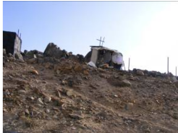
Fotografía 14: Gruta San Pedro