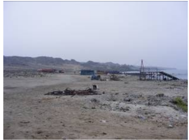
Fotografía 4. Uso del territorio, Sector Chascos.