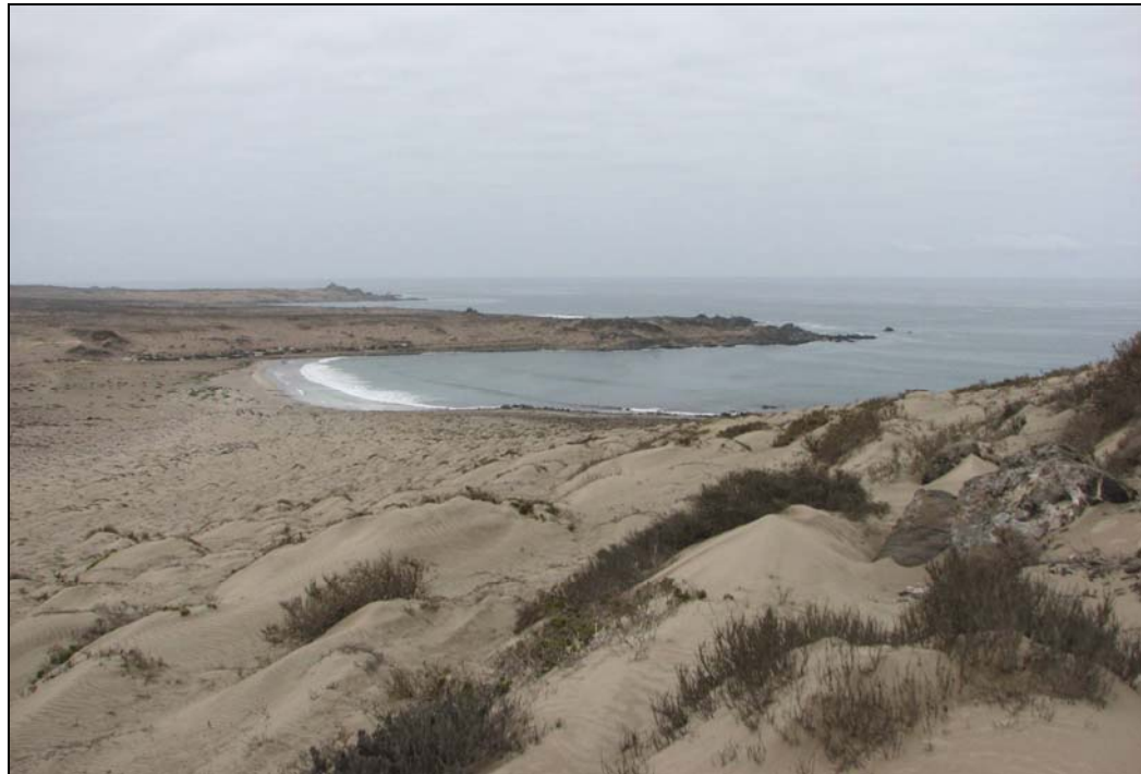
Fotografía 8. Caleta Pajonales.