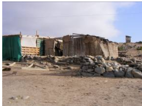
Fotografía 11 y 12. Viviendas, Sector Pajonales